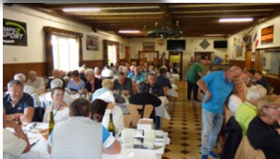
Banquet 70 ans Sainte Croix en Plaine

Le point d'orgue de ces activités devrait être notre participation à l'action conjointe avec la Ligue Contre le Cancer, reconduite par la Fédération, pour lutter contre le cancer du sein : "Octobre Rose". Même s'il est restreint à seulement un site, pour des raisons logistiques inhérentes à la Ligue départementale, notre Comité Sportif Régional et le club d'Avenir Rouffach ont aménagé un dispositif ludique qui ne demande qu'à faire ses preuves. Ils bénéficieront de l'appui des formateurs du Saint-Gall et seront soutenus dans leur action par la Ligue Grand Est B.S.Q. et le Comité Départemental 68.