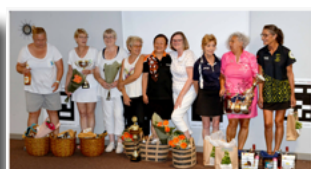
Podium 3ères équipes