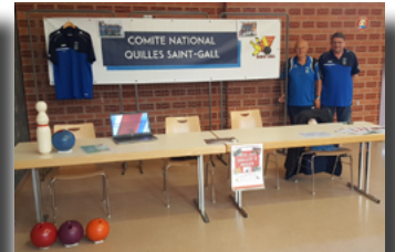
Forum des associations à Merxheim