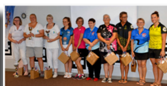
Les 10 meilleures individuelles