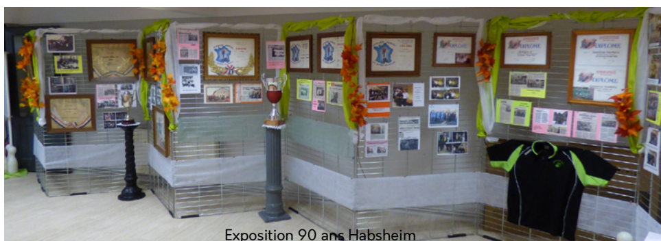
Exposition 90 ans Habsheim