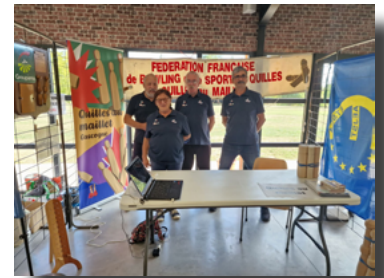
Le stand des Quilles au Maillet à Nogaro

La municipalité a néanmoins fait une entorse à la règle cette année, puisque l'École de Quilles au maillet de l'Adour, dont le siège social est basé à Laujuzan, commune voisine, était pour la première fois de la partie pour notre plus grand plaisir. Cela a été l'occasion de présenter la discipline et l'École de quilles au maillet de l'Adour.