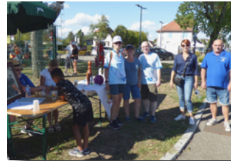
Journée des sports à Wittelsheim

Si les clubs de Quilles Saint-Gall ont repris le chemin des quilliers en ce début octobre, nombre d'entre eux ont très vite relancé les animations de toutes parts : fêtes diverses autour des quilles, tournois de pré-rentree; également, participations aux forums des associations et autres journées des sports organisées par les différentes communes haut-rhinoises. A grand renfort de plaquettes, affiches et flyers mis à disposition par l'équipe Communication de la Fédération, les clubs ouvrent les portes de leurs club-houses et les bénévoles prennent le temps d'accompagner les visiteurs profanes à la découverte de notre discipline sportive. Buts avoués de ces opérations : retrouver une autonomie de gestion fortement entamée, fidéliser les quilleuses et quilleurs qui reviennent (encore trop doucement) et susciter des vocations ; sortir les Quilles Saint Gall de l'anonymat où elles ont été plongées, retrouver la place qui est la sienne dans le patrimoine alsacien.