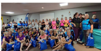
Une partie des triplettes