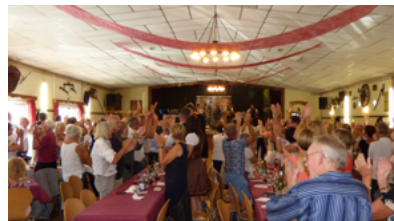
Schiffala Kegla - Wittelheim