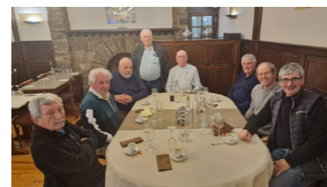
La nouvelle équipe de la C.S.N. des Quilles au Maillet à Pont de Salars (12)

Une réunion de la Commission Sportive Nationale des Quilles au Maillet s'est tenue à Pont de Salars (12) en ce début 2025 avec des projets pour la nouvelle année.