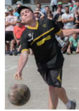
Quilles de 8