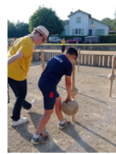
Quilles de 9