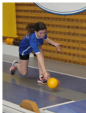
Ninepin bowling classic