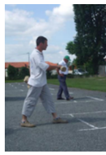
Quilles de 6