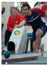
Ninepin bowling schere