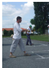
Quilles de 6