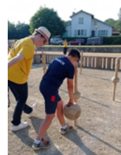
Quilles de 9