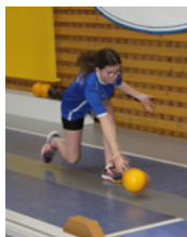
Ninepin bowling classic