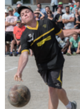
Quilles de 8