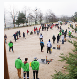
120 compétiteurs sur le terrain sénergues