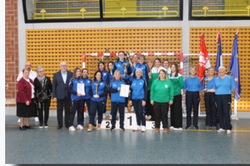
Les podiums Féminins et Masculins