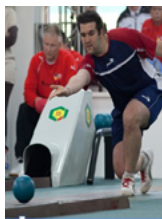
Ninepin bowling schere