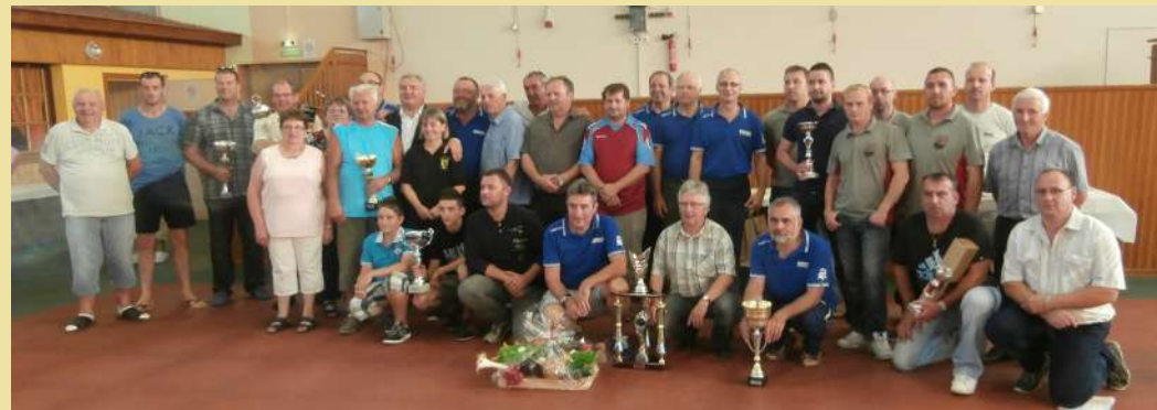
Les lauréats du Challenge de la Hardt 2014 organisé sur la piste de Rustenhart