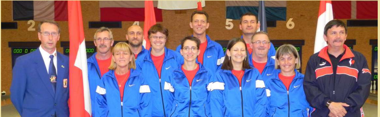
Les sélections féminines et masculines à Pétange (Luxembourg), la veille du premier tour de l'EM-NBBK.