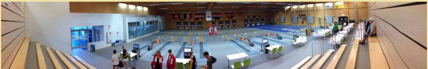
Un magnifique complexe et des joueurs concentrés ont été les ingrédients principaux de la réussite de cette première manche.