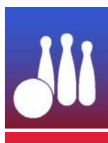
NINEPIN BOWLING CLASSIC