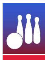
NINEPIN BOWLING SCHERE