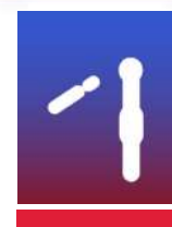
QUILLES AU MAILLET