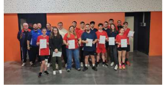
Une partie des compétiteurs avec quelques membres du staff

Enfin, le Grand Est a remporté la compétition avec un total de 6575 quilles renversées contre 6547 pour la Bourgogne Franche-Comté. Dans le détail, nous comptabilisons :