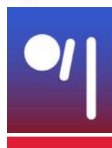
QUILLES DE 8