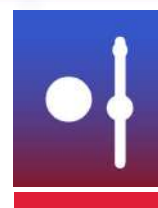
QUILLES DE 9