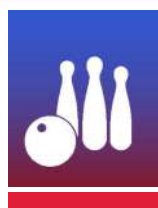
QUILLES DE SAINT-GALL