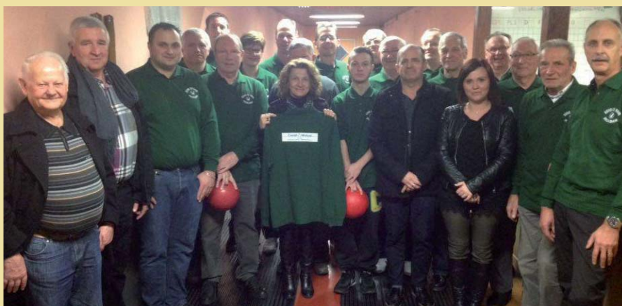
Les élus, sponsors et joueurs de Volgelsheim avec la nouvelle tenue.