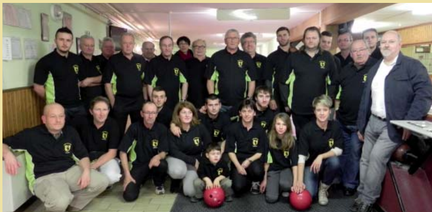
Les quilleurs de l'Avenir Obersaasheim et leurs nouvelles tenues.