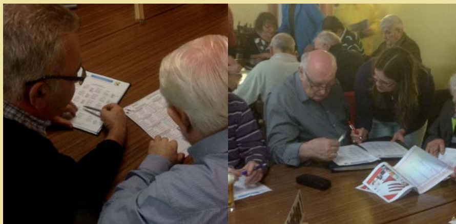
Concertations entre les capitaines d'équipe.